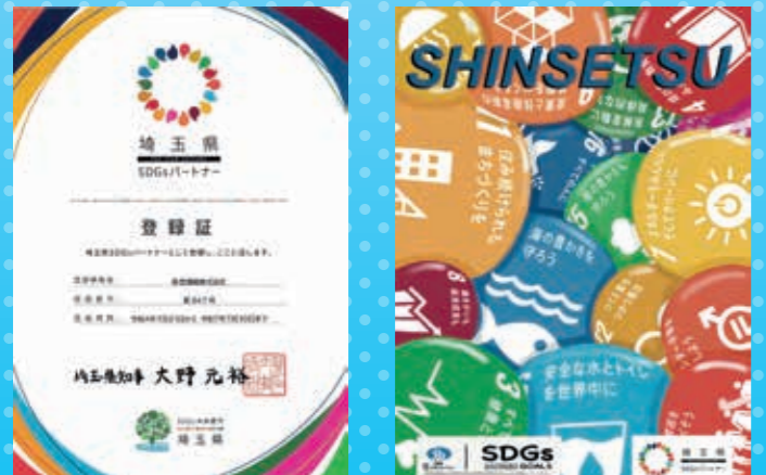
ポスター制作 野田営業所 O氏